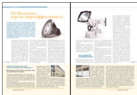
Две полосы (разворот)