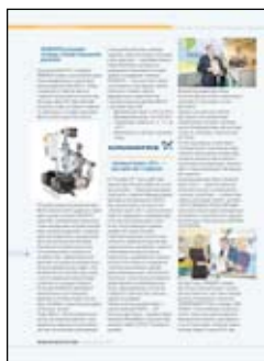
Новости, события, факты